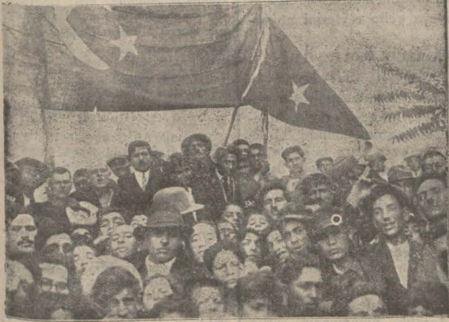
Arkadaşlarımızın (Yeşil Bayrak) dedikleri filâmaya bakınız. Bu filâmânı... günde duran genç mekteplilerin yaşlarını tahmin ediniz ve hükümlünüz veriniz.