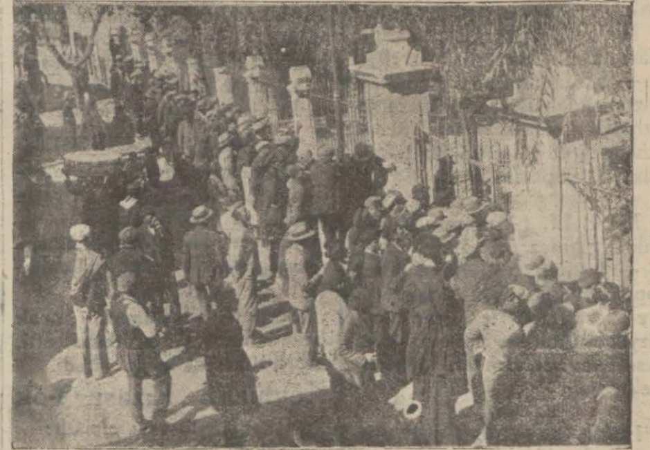
Kapı kapanmıştı, halk dört taraftan camın etrafını kuşattı, içerde olup biten görebilmek için parmaklıklara tırmanmaya kalkıştı.

Efendiler, Fırkacılığı, Vatan Çocuklarını Tahkir Edecek Kadar İleriye Götürmeyiniz!.. Siz De Bilirsiniz Ki Bu Memlekette "Apostol," ların Fırkası Yoktur.. Kumkapı İntihabı Elim Bir Şekilde Cereyan Etti..