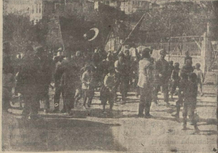
Daha sabahleyin erkenden bütün Kasımpaşa yola döktüldü, kaffle kaffle camin önünü doldurmaya başladı, birân geldi ki burası mahşerî bir hal aldı.